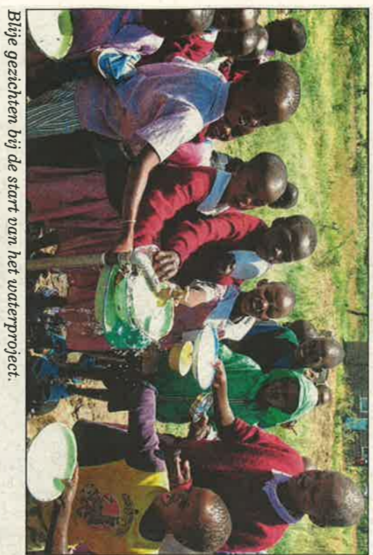
Blijde gezichten bij de start van het waterproject.