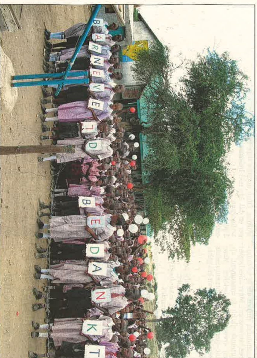
De leerlingen van de Nkoilale Primary School zijn Barneveld dankbaar voor alle hulp.

Het stichtingsbestuur mobiliseerde vooral veel basisscholen in de regio, die zich herhaaldelijk wilden inzetten voor het goede doel. Diverse scholen in Barneveld, Voortuizen, Nijkerk, Ede en Woudenberg, samen goed voor zo'n 3.000 leerlingen, hebben voor vele tienduizenden euro's ingezameld. Geweldig! Onze kracht was dat we telkens terugkwamen om de leerlingen te laten zien wat we met hun geld hadden gerealiseerd. Ze konden met eigen ogen zien dat er mede dankzij hun inspanningen bijvoorbeeld nieuwe klaslokalen waren gebouwd. Nou, dan wil je nog wel een keer je best doen tijdens een sponsorloop.” Om de verre Keniaanse wereld een klein beetje dichterbij te brengen,